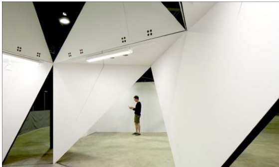
Symposium international d'art contemporain , Baie-Saint-Paul Musée d'art contemporain de Baie-Saint-Paul

On peut voir actuellement leur projet HAIE qui prend place pour une année au coin des rues Ste-Catherine et Wolfe, installation spatiale et visuelle lauréate du Concours Aire Banque Nationale dans le cadre du festival Aires libres 2014.