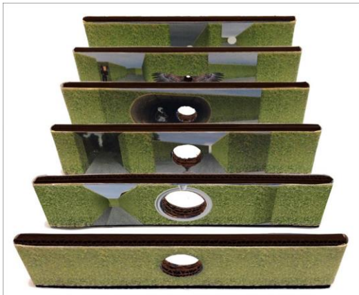
Haie , Montréal (Festival Aires Libres 2014) Lauréat du concours