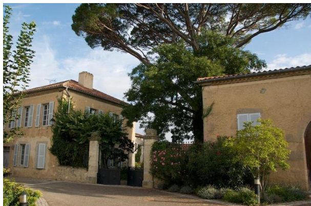
Place du village

À 2 heures de Bordeaux, et de son centre d'exposition en architecture Arc en rêve , Roques permet de rayonner à plus large échelle. Les vastes bâtisses de la demeure hôte, datant du XIII e au XIX e siècle, entourent un jardin naturel, un potager et un verger. Cet ensemble rural d'une rare authenticité a été l'objet de cinq ans de restaurations sous la direction d'un architecte du patrimoine. Propice à la concentration pour un projet de création dans la calme solitude, ce cadre offre aussi un accès privilégié à une région préservée d'une exceptionnelle richesse, tant du point de vue du patrimoine bâti et du vivace savoir-faire qui s'y rattache que du point de vue de l'histoire des paysages et du développement villageois ancien. Ce sera ainsi l'occasion pour notre lauréat d'explorer le territoire, de découvrir l'identité, la spécificité territoriale et culturelle du contexte dans lequel l'installation sera intégrée et de faire un choix éclairé quant au lieu d'occupation.