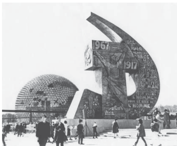
Coexistence pacifique ? La faucille soviétique et le dôme américain

De 2005 à 2008, il a enseigné à l'Université de Nantes, et en 2011 à l'Université du Québec en Outaouais. Ses communications ont été données dans les universités de France (dont la Sorbonne et Rennes II), Angleterre (Liverpool Hope University), Russie (Université d'Etat de Moscou), Canada (dont l'Université du Québec à Montréal, McGill) et Etats-Unis (Savannah College of Art and Design), ou dans des musées (Museo Nacional de Bellas Artes, Cuba)... De plus, il vient de rejoindre l'équipe scientifique de la future exposition Le Nôtre 2013 au Château de Versailles (pour y présenter l'influence du jardin à la française en URSS) et a été nommé Chercheur associé à l'Ecole Nationale Supérieure d'Architecture de Versailles.