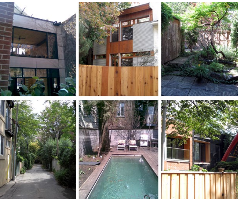
Repérages Ruelles

Sous l'effet d'une croissance nouvelle, le cœur du Montréal résidentiel, autrefois en décrépitude, connaît une réelle renaissance, avec l'arrivée d'une population plus jeune, urbaine et éduquée, qui cherche à s'établir dans les murs de la grande ville. Dans des quartiers comme le Plateau, on voit la hausse permanente des valeurs foncières et de la poussée démographique provoquer l'expansion et les agrandissements des maisons par la face arrière.