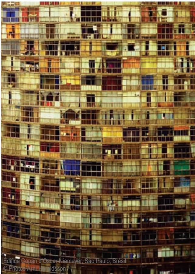
Edifice Copan d'Oscar Niemeyer, São Paulo, Brésil